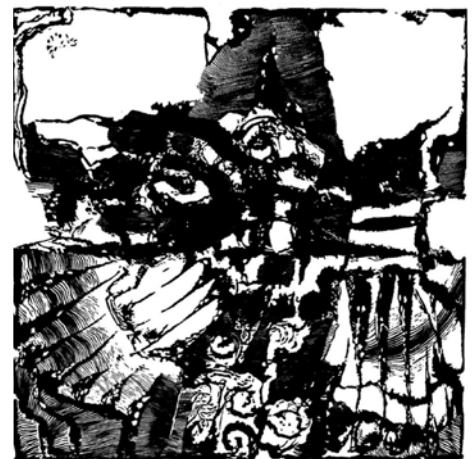
Jedna z prac Henryka Jasińskiego.