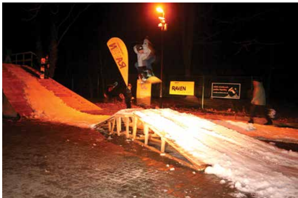
Specjalnie dla młodzieży za lodowiskiem powstała snowboardowa platforma treningowa.

Freestyle'owy snowboard jest sportem eks-