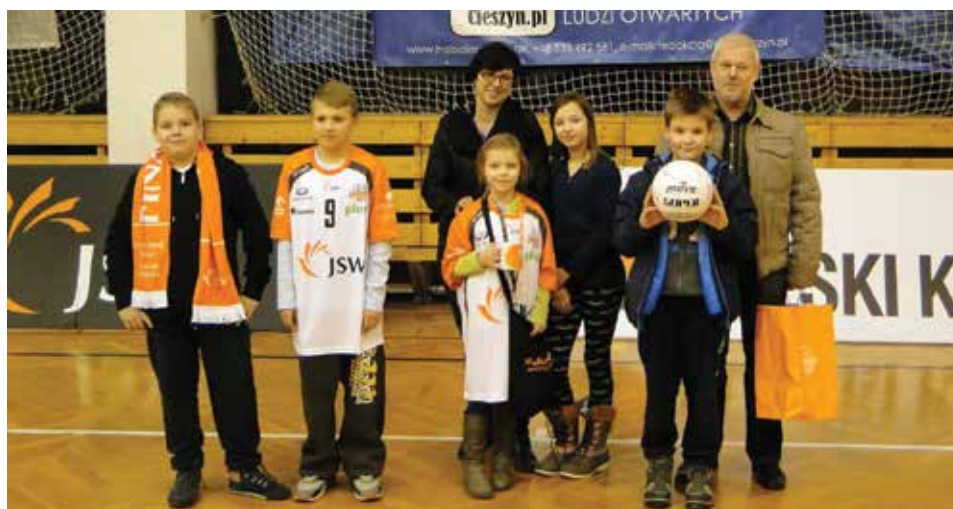
Nie tylko sportowe emocje, ale także konkursy z nagrodami czekały na kibiców siatkówki.