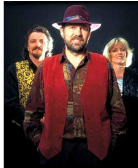
Po uroczystości wystąpi zespół Gang Marcela.